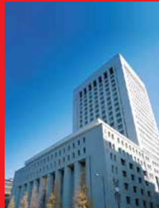
Tòa nhà trụ sở Dai-ichi Life Holdings tại Tokyo, Nhật Bản